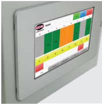
Интуитивный интерфейс управления