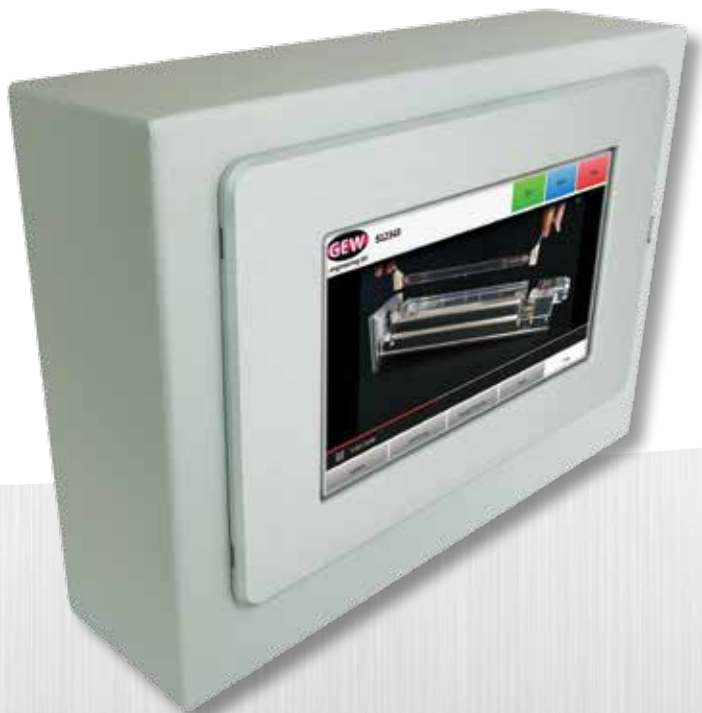
Сенсорная панель RHINO с демонстрацией обучающего видеокурса