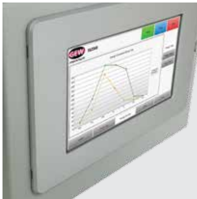
Монитор использования энергии